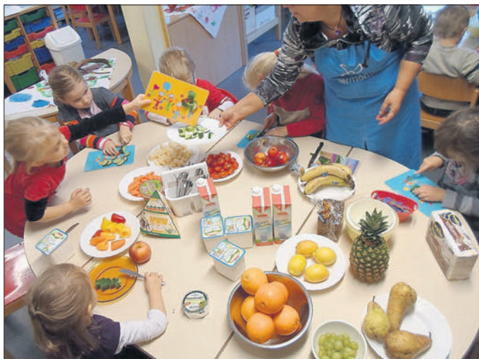
Von Katja Zengerling, einer Mama, die es super findet, solch tolle Projektstage zu begleiten.